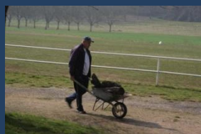
et toujours le même qui bosse