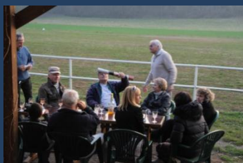
La récompense pour Maya. Une superbe affiche de ..... Monsieur Chazal.