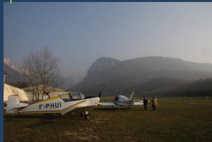
Le soleil arrive, les avions sortent.