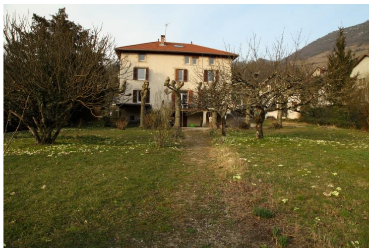
Le Clidou côté rue et côté jardin